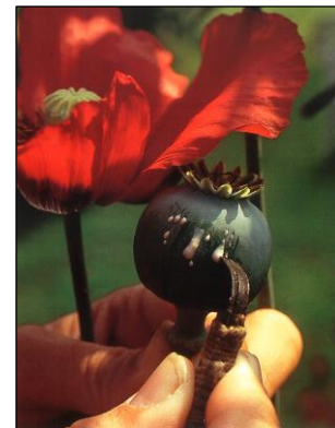
Der Mohn in der Homöopathie