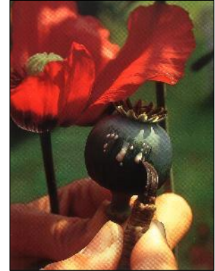
Der Mohn in der Homöopathie